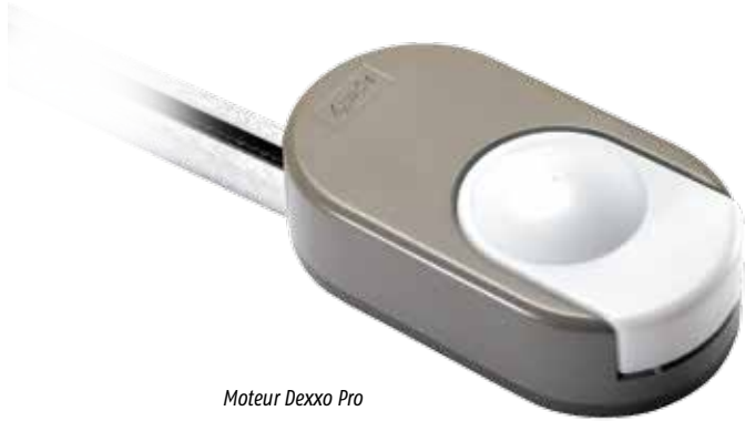
Moteur Dexxo Pro