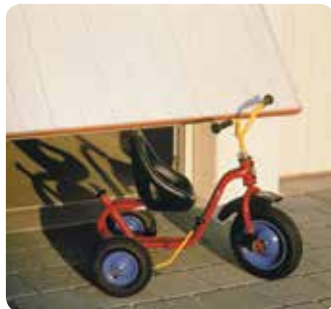
Détection d'obstacle automatique