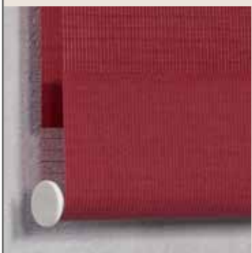
Barre de lestage invisible

Si vous choisissez un store à cassette, une barre de lestage apparente peut donner une finition appropriée à votre store.